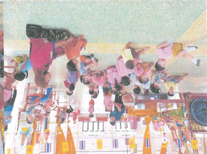
៩១៥២'២'៧ រថភេនរាពេលព្រឹក