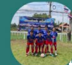
จ๊ะเอ๋ BY ผู้ใหญ่ตุ๊ก