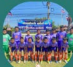
คลองสมบูรณ์ BY คลองโพธิ์ระกาเดย์

ทีมรองชนะเลิศ อันดับ 1 ทีมรองชนะเลิศ อันดับ 2 ทีมรองชนะเลิศ อันดับ 3