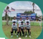
ถั่วปรางหวาน

ทีมรองชนะเลิศ อันดับ 1 ทีมรองชนะเลิศ อันดับ 2 ทีมรองชนะเลิศ อันดับ 3