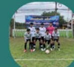
หนองตะเคียน