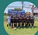
น้องจอมเจี๋ย

ทีมรองชนะเลิศ อันดับ 1 ทีมรองชนะเลิศ อันดับ 2 ทีมรองชนะเลิศ อันดับ 3