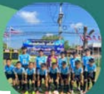
หนองหว้า อ.เกาะเดย์

ทีมรองชนะเลิศ อันดับ 1 ทีมรองชนะเลิศ อันดับ 2 ทีมรองชนะเลิศ อันดับ 3