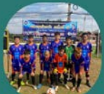
304 King Kong