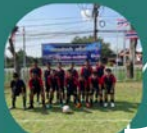
โรงเรียนชุมชนบ้าน สมอ(สามัคคีวิทยา)

การแข่งขันฟุตบอล 7 คน (ชาย) รุ่นประชาชนทั่วไป โครงการแข่งขันกีฬาด้านยาเสพติด ประจำปีงบประมาณ พ.ศ. 2567 ณ สนามกีฬาโรงเรียนชุมชนบ้านเกาะสมอ (สามัคคีวิทยา)