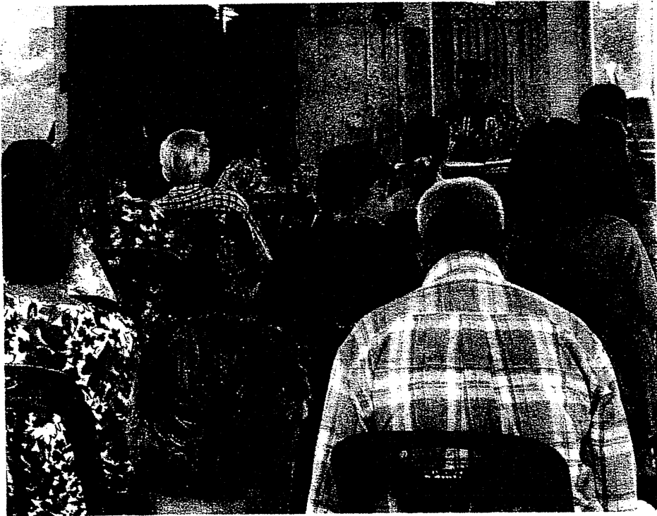
ภาพการประชุมประชาคมหมู่บ้านและกรรมการหมู่บ้านดอนสับฟาก

วันที่ 25 สิงหาคม 2567 เวลา 17.20 น.ณ ศาลากลางหมู่บ้านดอนสับฟาก ตำบลหัวหว้า อำเภอสริมหาโพธิ จังหวัดปราจีนบุรี