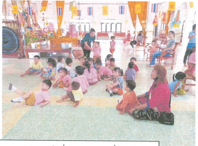
เด็กบางคนเล่นบาง ฟังพระสวดบ้าง ธรรมชาติของเด็กที่ไม่สามารถอยู่นิ่งได้เป็น

- เวลา ๐๙.๔๐ น. ดำเนินการตามกิจกรรม ทำความสะอาด