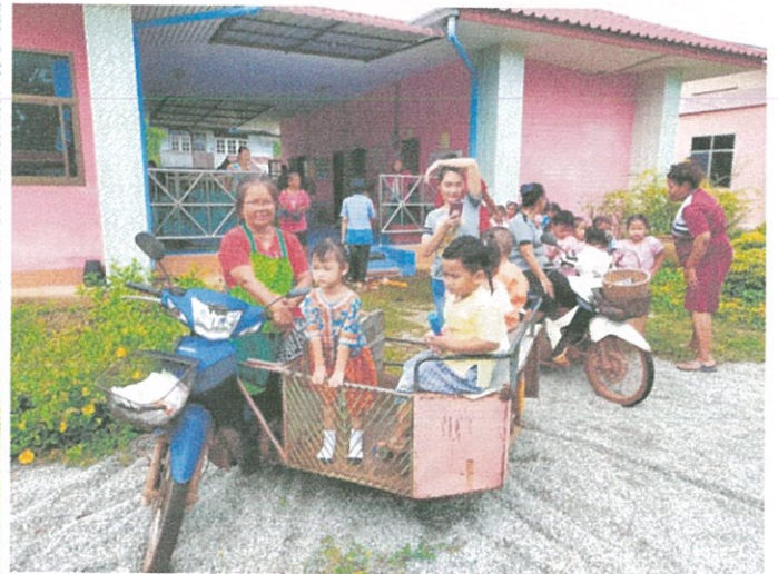
เด็กๆ ตื่นเต้นขึ้นสามล้อต่อแถวกันไปวัด บางส่วนมีครูหรือผู้ปกครองต้องจับมือเพื่อเดินไปด้วย เด็กแตกแถวบ้างเล่นกัน วิ่งบ้างบางคน แต่ทุกคนอยู่ในความดูแลของคุณครูตลอด

- เวลา ๐๙.๒๐ น. ถึงวัดหัวซารธรรมิการามไปถวายสังฆทานและรับศีล รับพร พร้อมทั้งผู้ปกครอง เด็ก และคุณครู